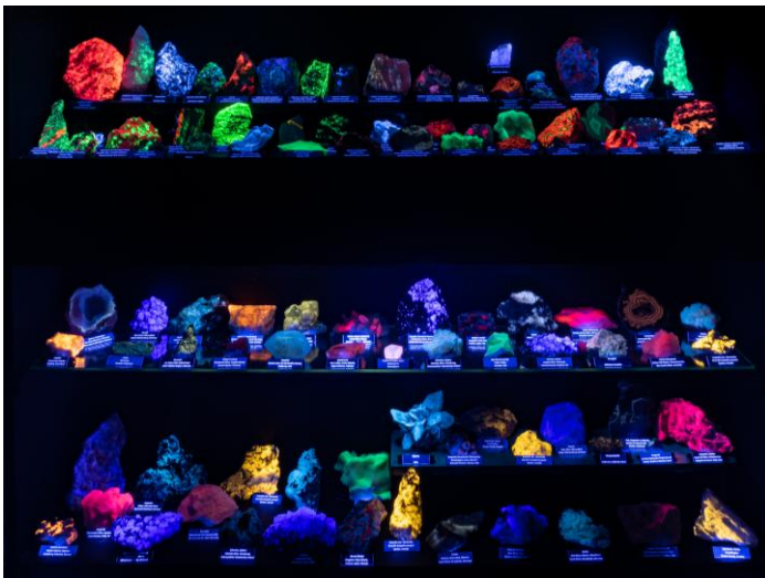
De fluorescentiekast van het museum

Het museum heeft een vaste collectie van mineralen, fossielen en gesteenten en er is een uitgebreide collectie van zand van over de hele wereld.